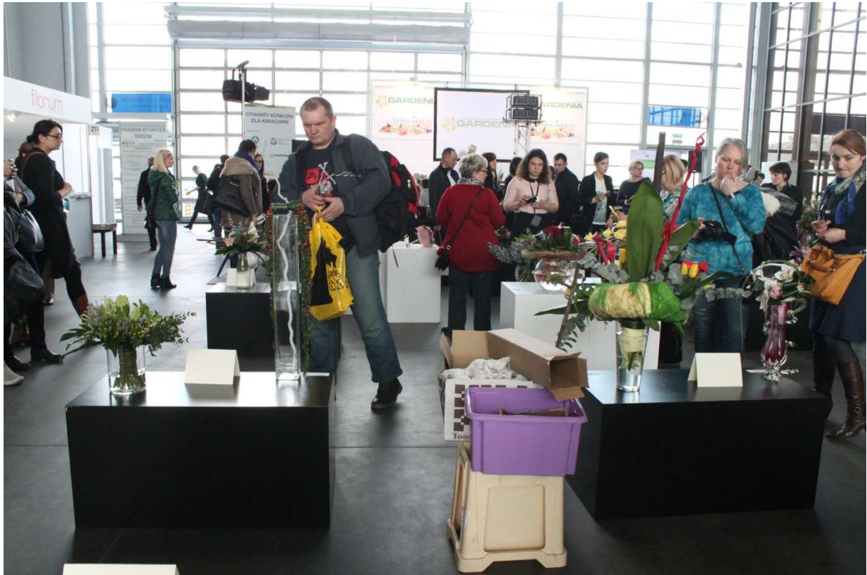
Uczniowie mieli możliwość oglądania pokazów florystycznych o tematyce wiosennej.