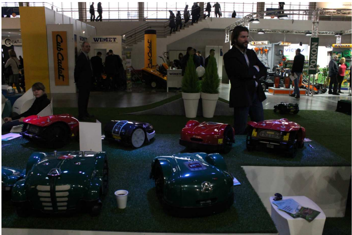
Nowość na rynku – kosiarki samojezdne.