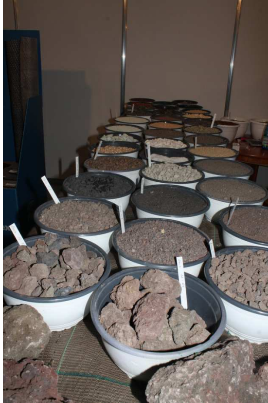
Rodzaje kruszyw i ich zastosowanie w terenach zieleni.