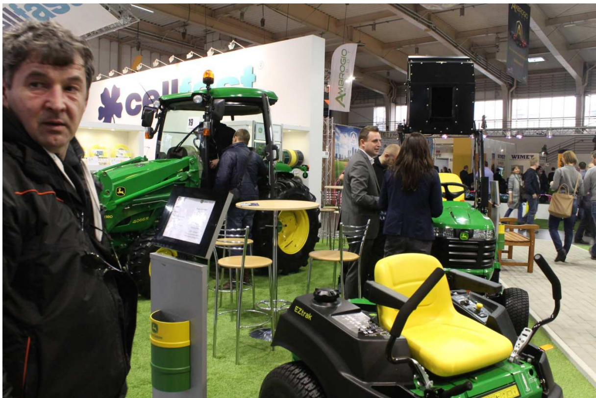
Maszyny i sprzęt używany do pielęgnacji terenów zieleni.