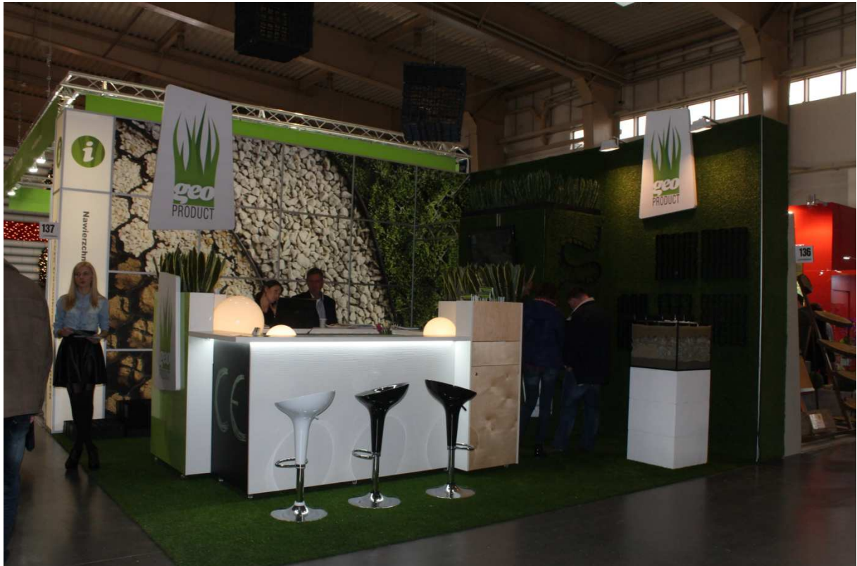
Producenci elementów do wykonywania nawierzchni czynnych biologicznie.