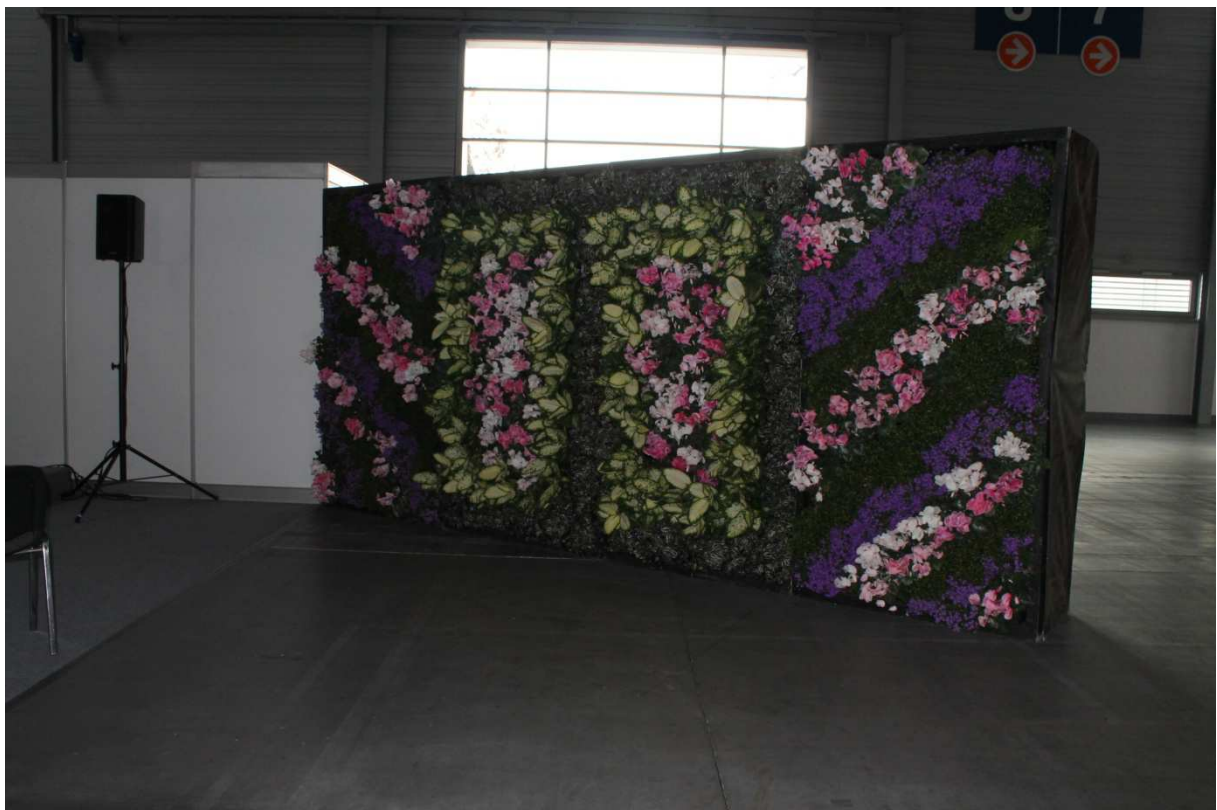
Ściany wertykalne jako nowoczesna forma wprowadzania roślinności do miast.