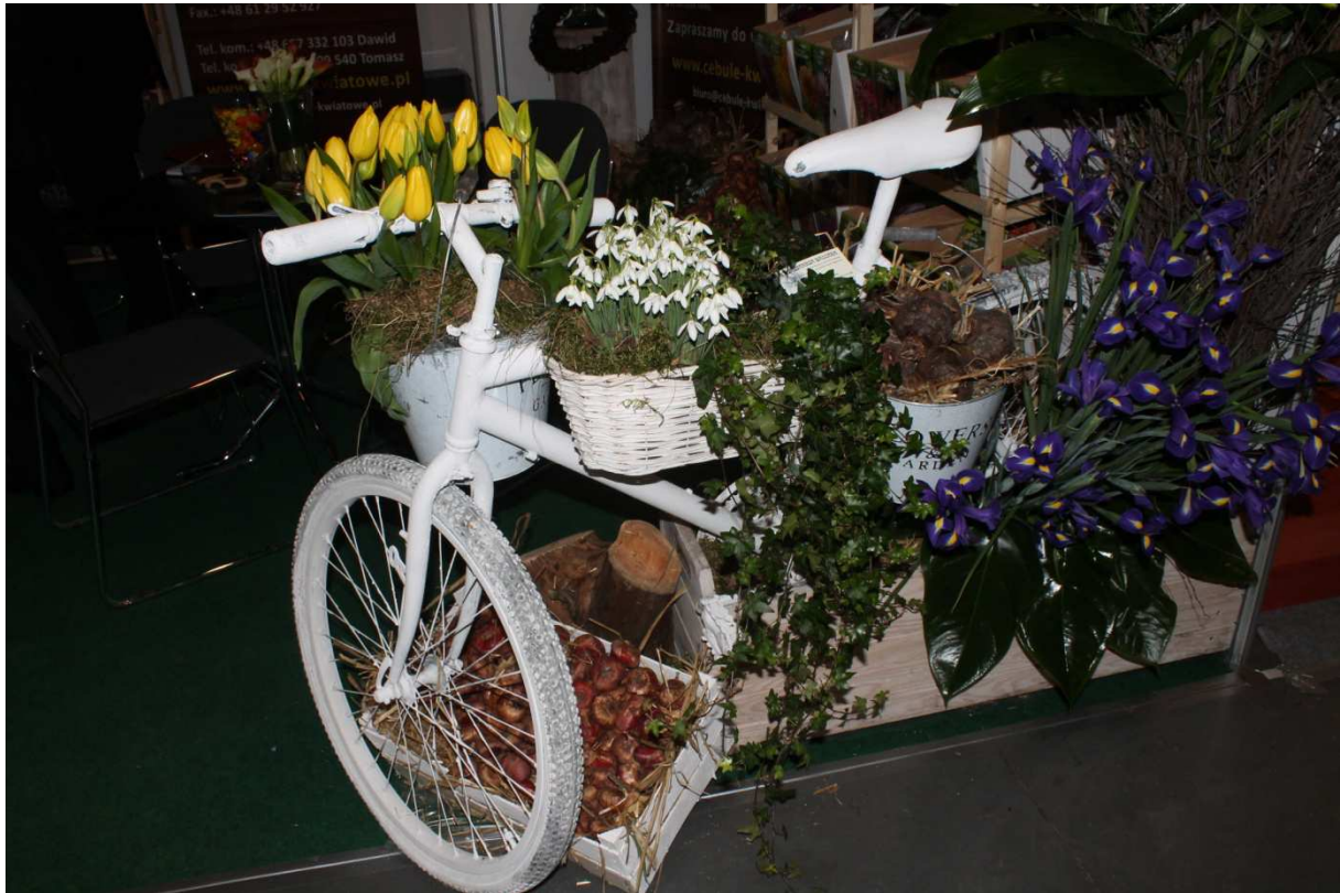
Ogrody z recyklingu.